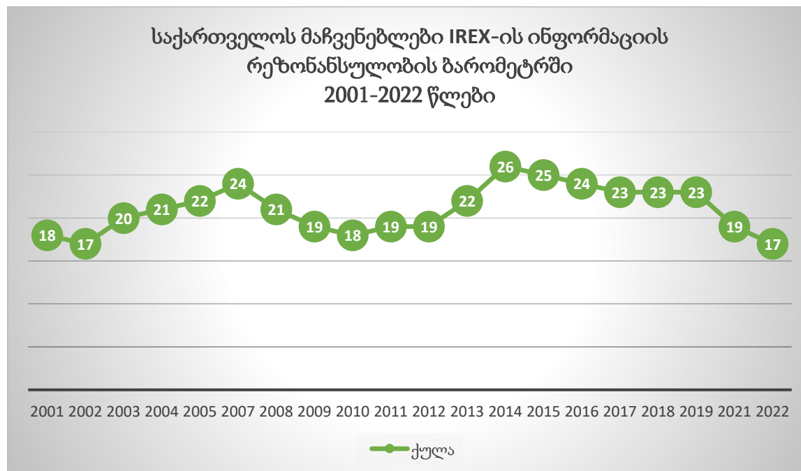
გრაფიკი 2: საქართველოს მაჩვენებლები IREX-ის ინფორმაციის რეზონანსულობის ბარომეტრში (2001-2022)

წყარო: საერთაშორისო კვლევებისა და გაცვლის საბჭო (IREX)